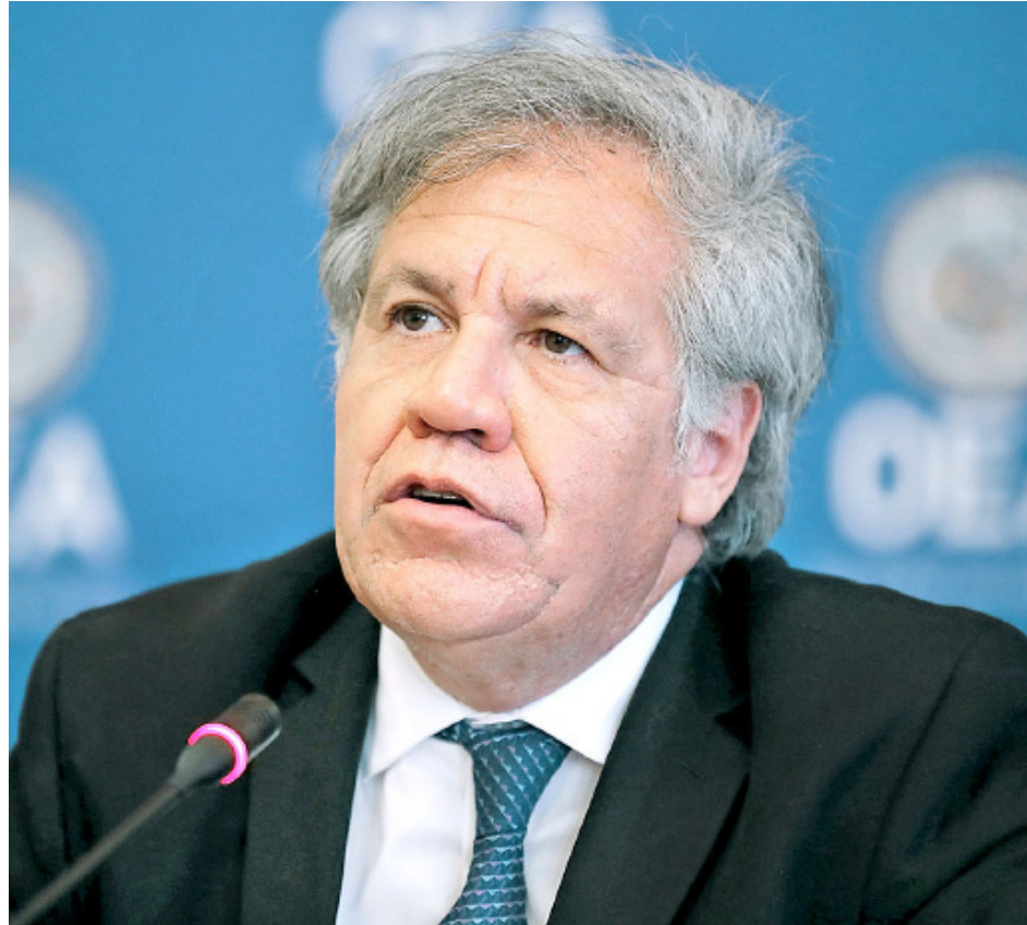
Luis Almagro.